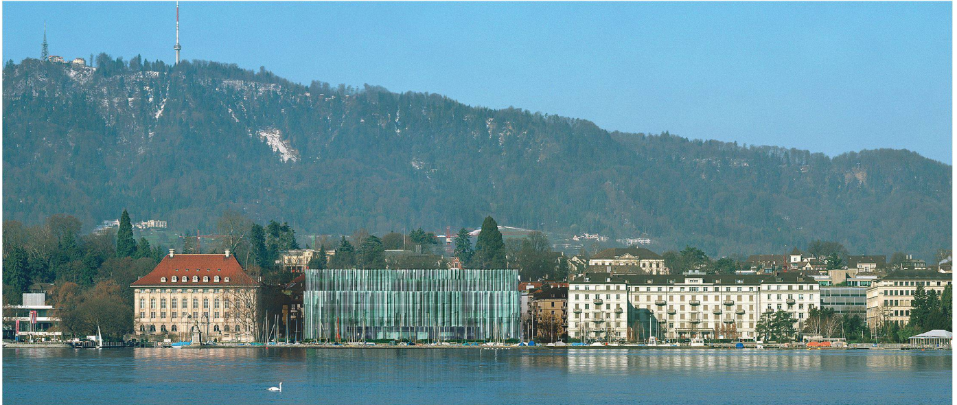
01 Beim geplanten neuen Hauptsitz der Swiss Re am Mythenquai in Zürich spielen Nachhaltigkeitsüberlegungen eine wichtige Rolle (Visualisierung: Diener & Diener Architekten, Basel)

«Die Nachfrage nach Produkten junger Cleantech-Firmen korreliert direkt mit dem Preis fossiler Brennstoffe. Wie man sie fördern könnte, ist demnach klar. Eine CO 2 -Steuer genügt»