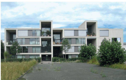
01 «Pile Up» in Rheinfelden

Der Einspruch mehrerer Architektenverbände gegen das Patent «Pile Up» wurde mit der mündlichen Verhandlung im zweitinstanzlichen Beschwerdeverfahren abgeschlossen.