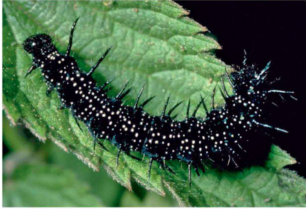
01 Ökologisch wertvoll und nützlich: Die Brennnessel ist eine Futterpflanze für Schmetterlingsraupen und ein Heilmittel

Der «Unkrautgarten» der Forschungsanstalt Agroscope Changins-Wädenswil (ACW) ist zu seinem 20-jährigen Bestehen neu eingerichtet worden.