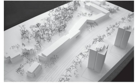
01 + 02 Siegerprojekt «Long John»: 250 Meter Wohnen (Visualisierung: sabarchitekten; Modellfotos: Remy Wipfler)

In Reinach BL sollen Wohnungen für Doppelverdiener, Familien mit Kindern und Einzelpersonen entstehen. Das Projekt von sabarchitekten mit einem 250m langen, kubisch gegliederten Baukörper als Pendant zu drei benachbarten Hochhäusern soll weiterbearbeitet werden.