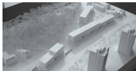
07 «Y_psihon»: Drei gradlinige Neubauten