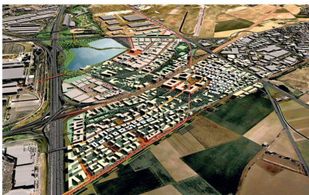
01 Masterplan für das 850 ha grosse Gebiet «Triangle de Gonesse» zwischen den Flughäfen Charles de Gaulle und Le Bourget in Paris (Visualisierung: Güller Güller architecture urbanism)

(af) Die Airport Regions Conference (ARC) verlieh im Dezember anlässlich ihrer Konfe-