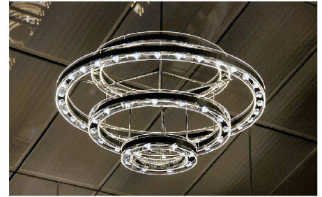
03 Konferenzraum im Parlamentsgebäude, Bern: Die Neuinterpretation des Kronleuchters ermöglicht, verschiedene Lichtsituationen zu erzeugen

während der Rest die Bogenkonstruktion gleichmässig beleuchtet. So entsteht ein für Passagiere und Zugführer blendfreies und sicheres Ambiente, das zugleich die Raumwirkung erlebbar macht. Wesentlich kleiner ist hingegen der Kirchenraum der fünfzig Jahre alten Zwinglikirche in Schaffhausen. Die für die Sanierung erarbeitete Lösung mit frei angeordneten Einbauleuchten und einer beispielbaren Lichtwand setzte die Jury auf den zweiten Platz. Den dritten Platz erreichten die modernen Kronleuchter im neuen Konferenzsaal über dem Ständerat. Jeder der sechs Leuchter besteht aus vier Acrylglasringen und ist mit LED-Technik ausgestattet, die eng, breit und diffus strahlen können. Statt wie bisher alle drei Jahre soll der Prix Lumière das nächste Mal bereits 2011 verliehen werden.