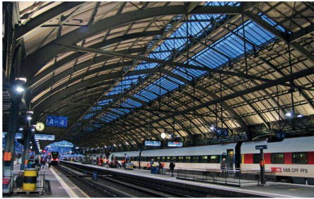
01 Perronhalle Bahnhof St. Gallen: Eine gezielt asymmetrische Lichtführung unterstützt die Raumwirkung der historischen Bahnhofshalle

Drei Lichtplanungen in sehr unterschiedlichen Raumsituationen erhielten den mit insgesamt 15 000 Franken dotierten Prix Lumière 2009.