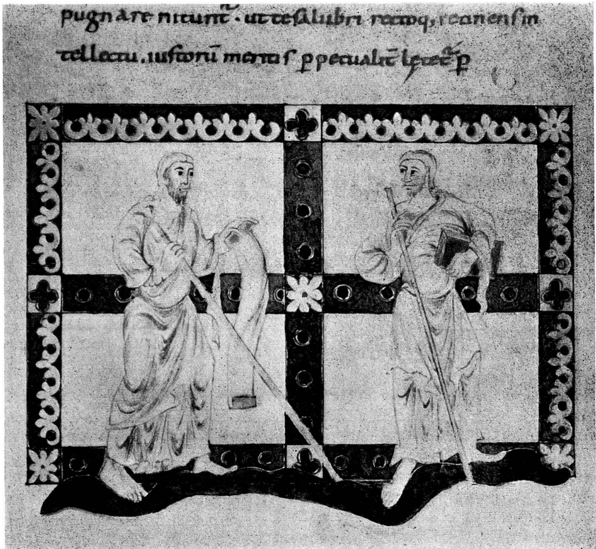
Abb. 1. Goldener Psalter der Stiftsbibliothek St. Gallen (Cod. 22, S. 150): Zwei Propheten

Ehe wir uns dessen genauerer Analyse zuwenden, sei auf die besondere künstlerische Qualität der Figuren hingewiesen. Von allen figürlichen Darstellungen des Psalterium Aureum sind sie in Proportion, Haltung und Bewegung die souveränsten. In der freien Art und Ponderation, wie sie auf dem wellenförmigen Stück Erdreich stehen, in der spannungsvollen, aber keineswegs abrupten Drehung der Körper, in deren Drapierung, in der Beziehung beider Figuren zueinander werden geradezu antikische, klassische Elemente sichtbar. Am nächsten liegt stilistisch die Gestalt Samuels in der Miniatur der Salbung Davids. Man fühlt sich über die Malerei hinaus an Bildwerke erinnert, an die Prophetengestalten romanischer Skulpturenzyklen, aber auch – und sicher mit noch besseren Gründen – an die karolingische Bildhauerei, die kleine der Elfenbeintafeln und die Großplastik in Stuck. Da die beiden Prophetengestalten der St.-Galler Miniatur im Prinzip hell leuchtend, nur farblich laviert erscheinen, gemahnen sie ganz besonders an transparent und nur teilweise gefaßte Stuckplastiken (vgl. solche Werke in Disentis, Münstair, Mals und Cividale).