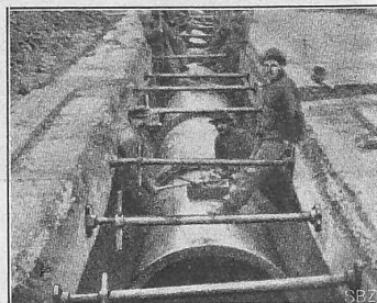
Abb. 18. Anwendung ausziehbarer Spiessen.

Die hier verarbeiteten Daten wurden, soweit sie nicht auf den besuchten Baustellen selbst gesammelt sind, teilweise einschlägigen Publikationen in: „Engineering News“ und „Engineering Record“, zum teil aber auch aus direkten Mitteilungen und Reklamebroschüren der: „Friestedt Interlocking Channel Bar-Co.“, „Wittekind Interlocking Metal Piling Co.“, „United States Steel Piling Co.“, „Vanderkloot Steel Piling Co.“, alle vier in Chicago, und der „Dunn Manufacturing Co.“ und „Duff Manufacturing Co.“, beide in Pittsburg, entnommen und dürften auch für schweizerische Ingenieure und Bauunternehmer von Interesse sein.