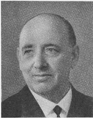
OTTO DÜRR ARCHITEKT