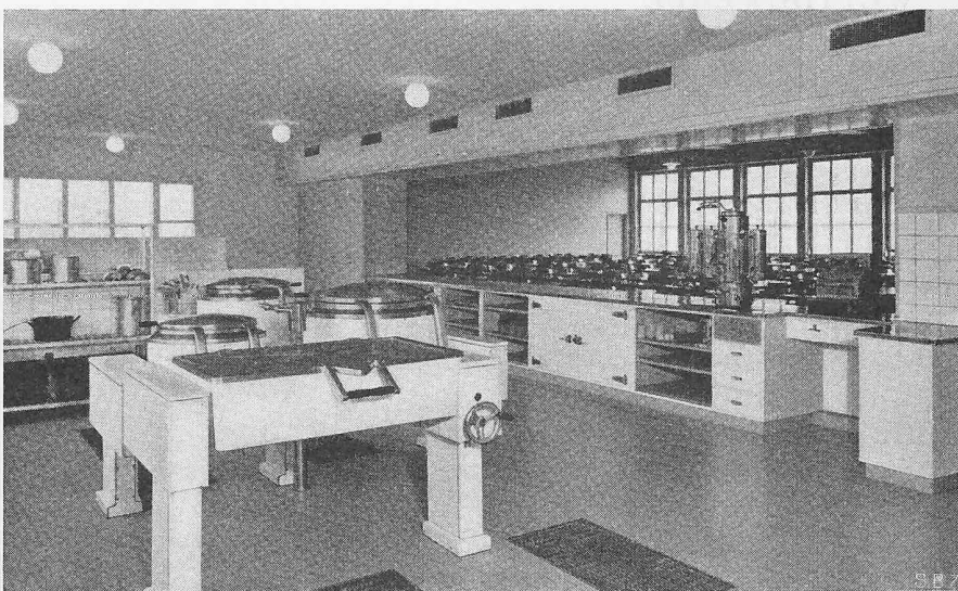
Bild 8. Küchenanlage mit Blick gegen Arbeiterspeisesaal.