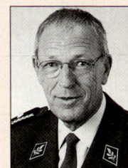
Walter Knutti, Brigadier, Chef Stab Luftwaffe, wird auf den 1. Januar 2006 zum Kdt Luftwaffe ernannt und zum Korpskommandanten befördert, 1595 Faoug.

Bis zu neuerlichen, weiteren Anpassungen wird es aber für die Luftwaffe vorab darum gehen, die neuen Strukturen zum Leben zu erwecken, dort wo prozessuale Schnitte ungünstig liegen, Feinkorrekturen vorzunehmen und dafür zu sorgen, dass die «neue» Luftwaffe eine grösstmögliche Handlungsfreiheit erhalten kann, die es ihr ermöglicht, weiterhin rasch und zuverlässig in höchster Qualität ihren Auftrag im Luftraum selbstständig und ohne künstliche oder unnötige Hindernisse zu Gunsten von Armee und Bevölkerung zu erfüllen. ■