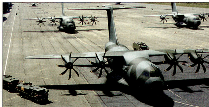
Zukünftiges europäisches Transportflugzeug A-400M.

Allerdings ist weiterhin fraglich, ob diese geplanten Beschaffungen in den einzelnen Staaten zeitgerecht erfolgen und vollumfänglich finanziert werden können. hg