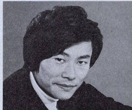
Kisho N. Kurokawa

Geboren 1934 in Nagoya. Studium an der Kyoto University 1957 und Tokyo University 1964. Mitarbeit bei Kenzo Tange 1958 bis 1965. Seit 1962 Präsident der Kisho N. Kurokawa Arch. + Ass., 1967 Präsident des Urban Design Consultant, 1970 Direktor des Instituts Social Engineering. Eigenes Büro seit 1962. Mitglied der Japan Architects Association, Architectural Institute of Japan, Japan Society of Futurology. Auszeichnungen: 1969 Erster Preis des Pilot Low Cost Housing in Peru, 1971 Borbourg Center in Paris. 1972 Erster Preis New Tanu National Headquarters usw. Wichtige Bauten: Neue Stadt Hishino, 1968, Neue Stadt Fujisawa, 1970, Nakagin Geschäftskapsel, 1972, usw. Lesehalle, Chiba University, 1964, usw.