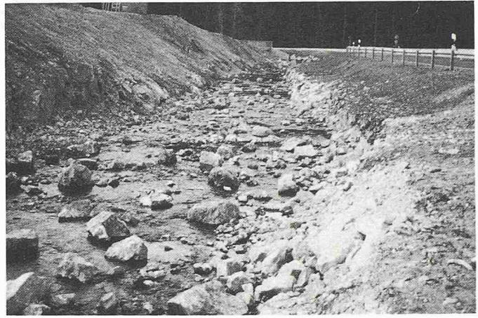
Bild 6. In naturgemässer Rähnenbauweise gestalteter Bachlauf