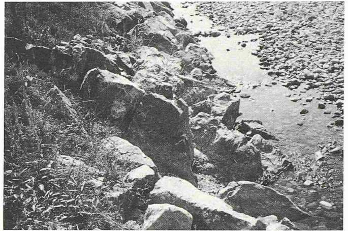
Bild 4. Naturgemässe Felsbankbauweise

sorgen, dass die Massnahmen unter Beachtung ökologischer und flussbaulicher Erfordernisse ausgeführt werden.