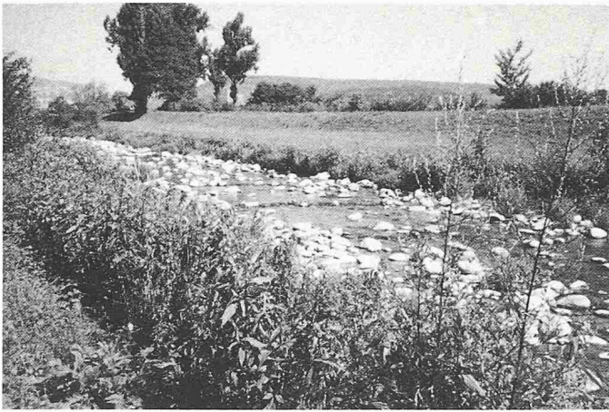
Bild 3. Sohlensicherung mit drei Kornfraktionen (Blöcke/ Gerölle/Feinsediment)