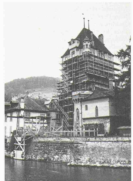
Schloss Oberhofen am Thunersee: Renovation

(Comet) Seit Anfang Mai steht der Bergfried von Schloss Oberhofen am Thunersee unter Renovation. Man rechnet drei bis vier Jahre für die Wiederherrichtung des Turmes. Neben den vielseitigen Aussenarbeiten wird auch das neugotische Inventar aus den Jahren 1851/1852 erneuert. Die Kosten von 2,7 Millionen Franken trägt die Stiftung Schloss Oberhofen.