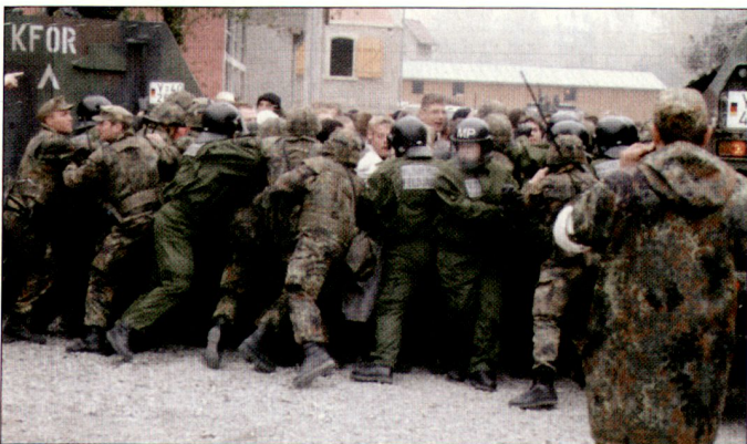
Ausbildung im Verhalten gegenüber Demonstranten an der Infanterieschule der Bundeswehr.

Verlangt wird vom Generalinspekteur deshalb ein tief greifender Prozess des Umdenkens innerhalb und ausserhalb der Bundeswehr. Neben den geplanten Anpassungen von Struktur und Organisation müsse auch der «mentalen Transformation» besondere Beachtung geschenkt werden. hg