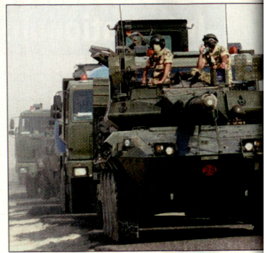
Italienischer Konvoi, geschützt durch Schützenpanzer «Centauro» im Irak.

Insbesondere im Zusammenhang mit der internationalen Terrorismusbekämpfung benötigen die britischen Streitkräfte speziell ausgebildete Truppen. Dadurch erhofft man sich – insbesondere auch nach den Anschlägen in London im Juli dieses Jahres – eine Effizienzsteigerung bei der Bekämpfung