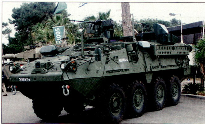
Schützenpanzer «Stryker», ausgerüstet mit dem aktiven Schutzsystem «Trophy».

Bei der Entwicklung von «Trophy» wurden sehr strenge Sicherheitsforderungen der Heeresruppen berücksichtigt. So sollen Hohlladungsgeschosse, vor allem auch sämtliche von RPGs verschossenen Geschosse rechtzeitig ausgeschaltet werden, ohne wesentliche Beeinträchtigung der eigenen Fahrzeuge. Es soll nur sehr vereinzelt zu geringen Kollateralschäden gekommen sein. Einsatztests und Simulationen haben zudem ergeben, dass die Gefährdung von sich in der Nähe befindender eigener Infanterie oder Fahrzeugbesatzungen durch Kollateralschäden praktisch nicht vorhanden ist. Das aktive Schutzsystem «Trophy» wird u. a. auch als Zusatzschutz für die amerikanischen Schützenpanzer «Stryker» angeboten. D.E.