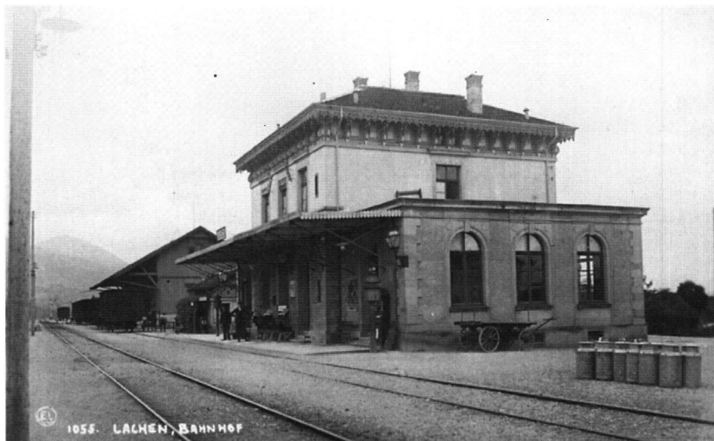
Abb. 1: Der Bahnhof von Lachen, 1875 erbaut, in einer Aufnahme um 1900.

Die Streckenführung und der Stationsbau der Nord-Ost-Bahn-Gesellschaft erregten aber auch die Gemüter. Vom neuen Verkehrsmittel wollten möglichst alle Dörfer profitieren. Diesem Wunsch konnte nicht entsprochen werden. Bekannt ist der unerfüllte Wunsch von Tuggen und Schübelbach, eine eigene Station zu erhalten. 22 Die Lokalpresse vom 9. Oktober 1875 berichtet von Anschlügen und Sabotageakten auf die Schienen in der Obermarch. Das Bezirksamt ermittelte gegen einen Peter Bruhin, genannt «Holländer», welcher aus Verärgerung über den nicht gewährten Bahnhof Schübelbach die Schienen gelöst hatte. Auch der Schreiber der Drohbriefe an die Direktion der Nordostbahn konnte zur Rechenschaft gezogen werden. Franz Xaver Benz im Schorrenhof zu Tuggen verfolgte mit seinen Drohschreiben das gleich Ziel wie Bruhin. 23