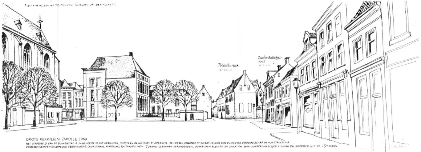
GROTE KERKPLEIN - ZWOLLE 1969 HET STADSBEELD VAN DE BINNENSTAD IS SAAMENGESTELD UIT GEBOUWEN, ONTSTAAN IN ALLEERLE TIJDPERKEN - ZE HEBBEN ONDANKS STIJLVERSCHILLEN EEN DUIDELIJKE VERWANTSCHAP IN HUN STRUCTUUR. DOOR EEN GEMEENSCHAPPELIJK VERTIKALISME, DOOR SMAAL, MATERIAAL EN DAKHELLING - TERWIJL GEBOUWEN VERANDEREN, BEHULDEN PLAZEN EN STRATEN HUN DOORSNODENLIJKE LICHTING EN BREEDTE UIT DE 13 e EEUW.