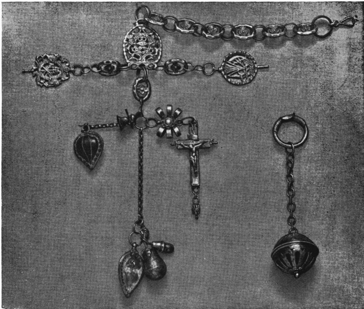
Fraiskette mit Medizinal-Amuletten und christlichem Anhänger. Durchbrochenes silbernes Kugelgehäuse zur Aufnahme von Pest- kugeln.

(Aus der Sammlung für historisches Apothekerwesen an der Universität Basel.)