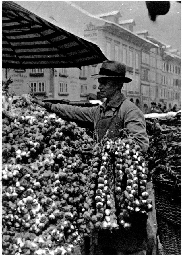
Schöne Knoblauch, dicki Züpfe