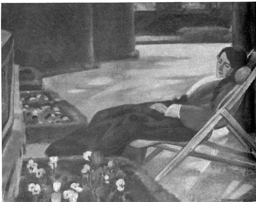
Emil Cardinaux — Genesende