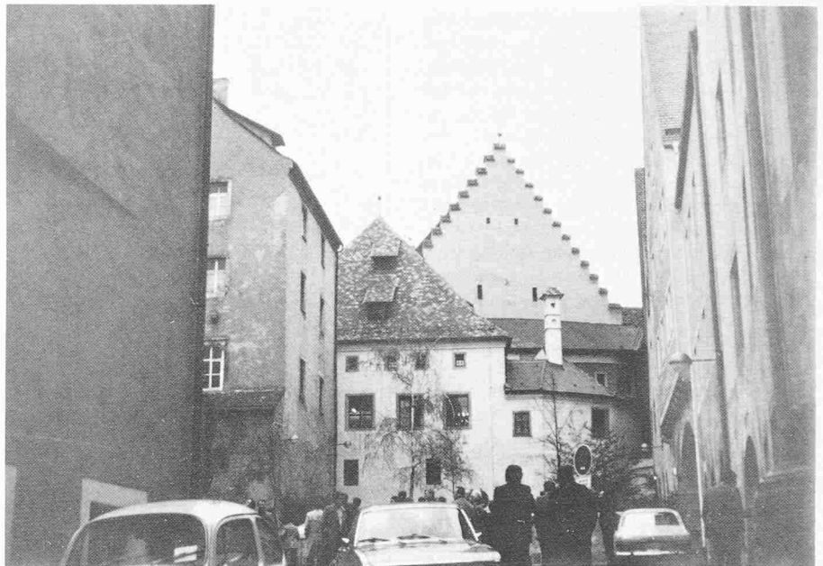
Bild 8. Altstadtsanierung Regensburg

Adresse der Verfasser: Institut für Orts-, Regional- und Landesplanung, Stabsstelle Reusstalforchung und Institut für Kulturtechnik, ETH-Hönggerberg, 8093 Zürich