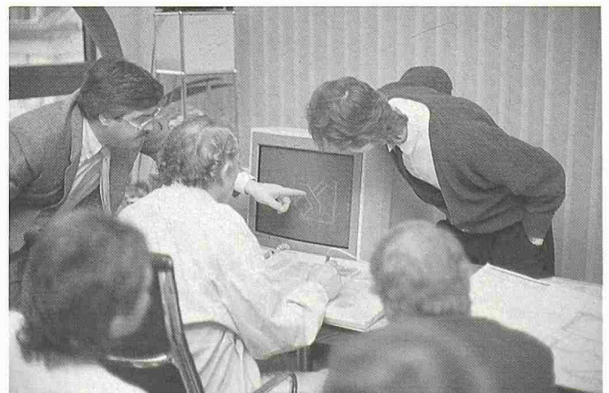
Bild 2. «Ich investiere lieber einen halben Tag in den SIA Workshop als viel Geld in eine CAD-Fehlentwicklung»