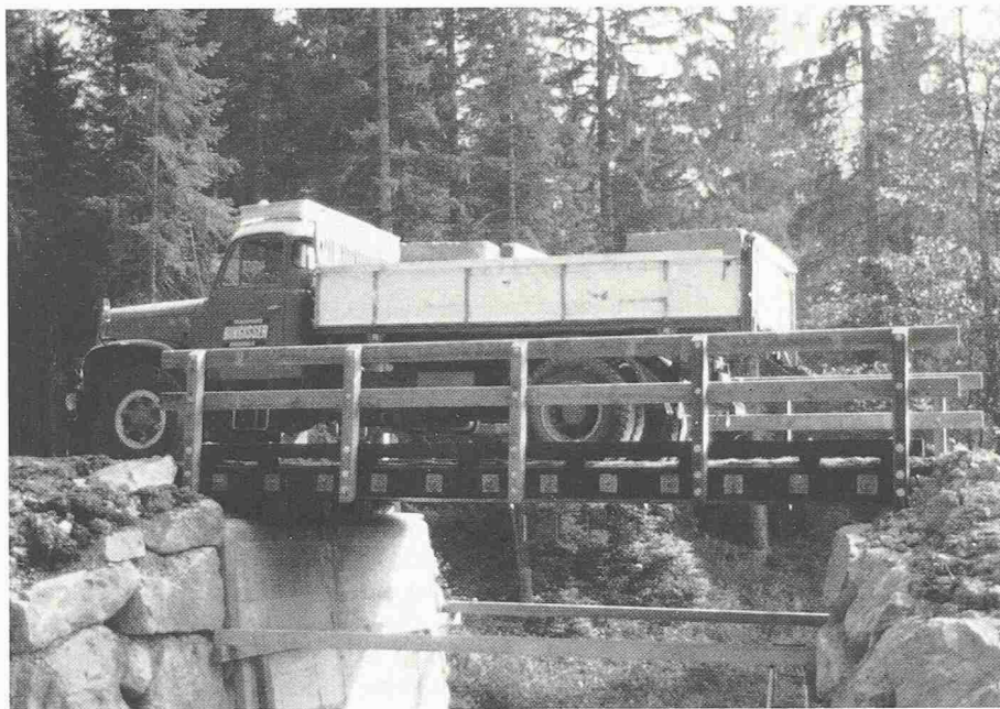
Bild 3. Brücke für Walderschliessungsstrassen

wicht der Untersuchungen an der ETH Zürich darin, das Verhalten einiger bereits ausgeführter Brücken zu beobachten.