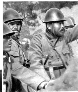
In einem japanischen Schützengraben

So wie jeder Kaiser und Minister Krieg und Frieden, Abreise und Anfall in der Heimat den Göttern mitteilen muß, ist es Pflicht jedes japanischen Soldaten vor Beginn eines Feldzuges, bei Abkommandierung und der Rückkehr vom Feldzug den Göttern Rechenschaft zu geben. Die japanischen Götter sind ja letzten Endes nur die Ahnen der jeweils lebenden Generationen, die ein Recht haben zu wissen, wie ihre Nachfahren das ewige Erbe der Familien und damit des ganzen japanischen Reiches verwalten.