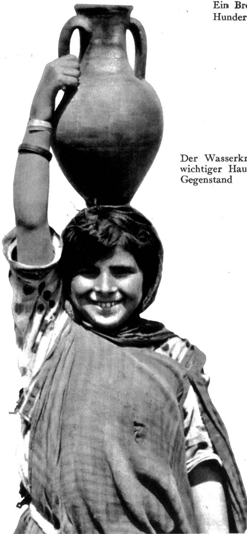
Der Wasserkrug, ein wichtiger Haushaltsgegenstand