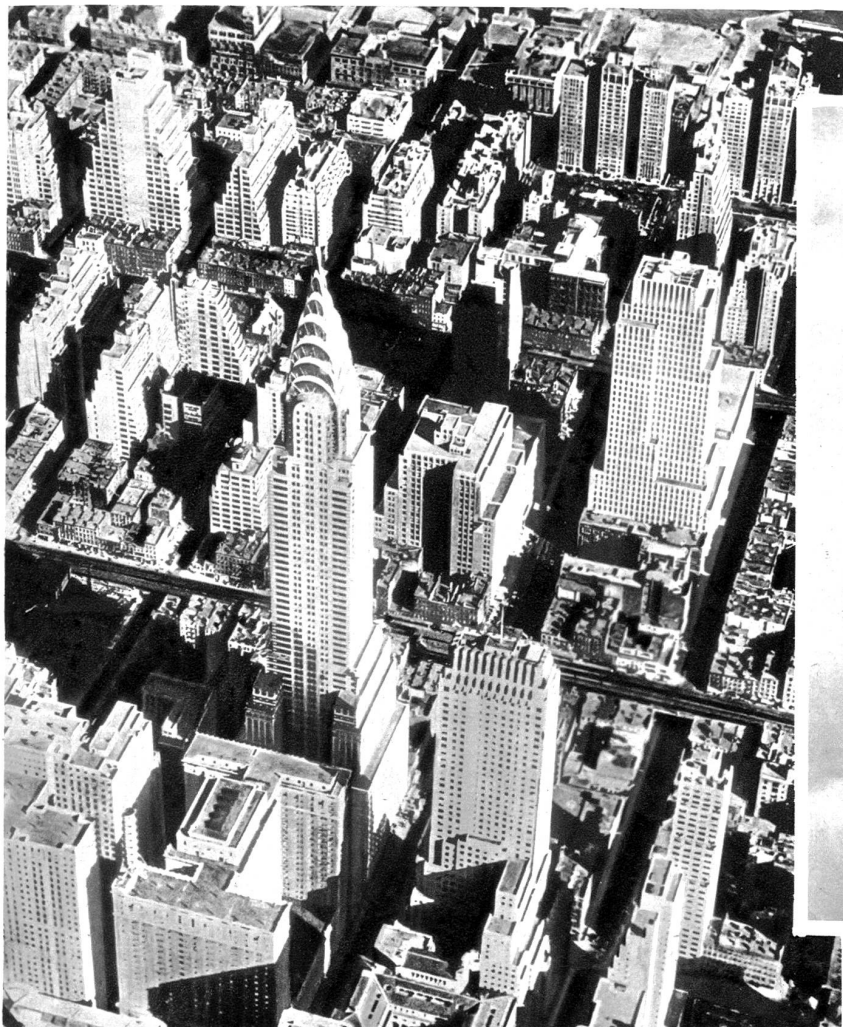
Das New Yorker Geschäftsviertel vom Flugzeug aus gesehen