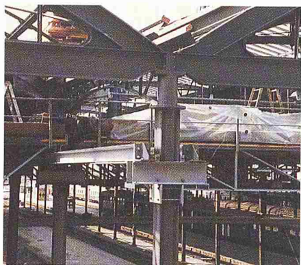
Bild 4. Nördliche Hallenverlängerung mit Schutz- und Arbeitsbühne