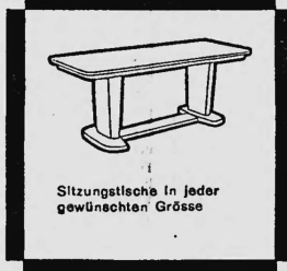
Sitzungstische in jeder gewünschten Grösse

Das Formpult unterscheidet sich von den früher gebräuchlichen Pulten und Schreibtischen durch vollständig neue Linienführung, verbunden mit zeitloser Eleganz und grösster Zweckmässigkeit. Es ist nach einem Spezialverfahren — Hochfrequenzverleimung und Formpressung — hergestellt und hat so ein um 25% geringeres