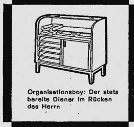
Organisationsboy: Der stets bereite Diener im Rücken des Herrn