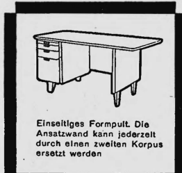
Einselliges Formpult. Die Ansatzwand kann jederzeit durch einen zweiten Korpus ersetzt werden