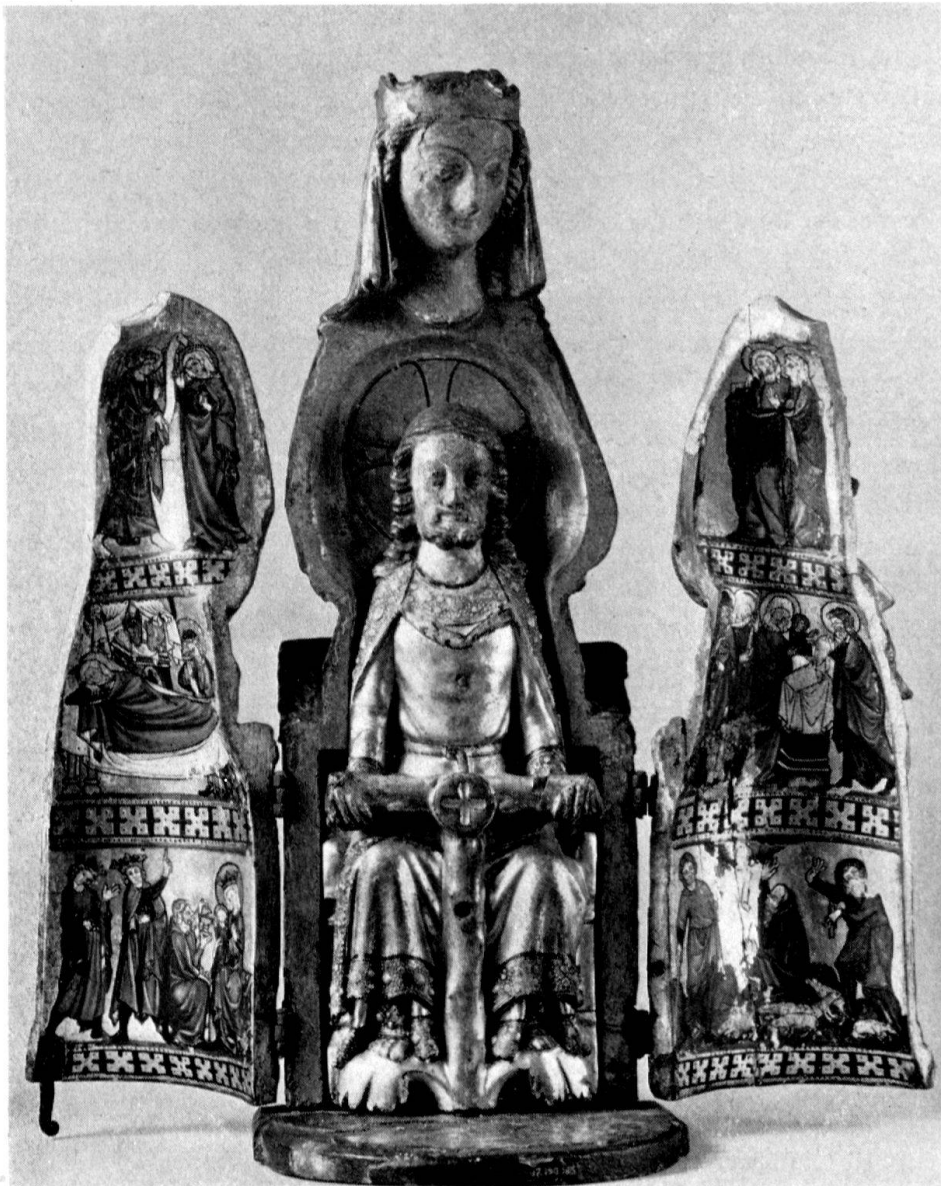
Schreinmadonna, geöffnet. Französisch, um 1300. Heute im Metropolitan Museum in New York (Aus Festschrift Stammler)

republik Deutschland. Die Bearbeitung lag bei Frau Renata Klée Gobert. Im ersten Band (1953) wird die Kunst des historischen Amtes Bergedorf mit den Vierlanden und die der Marschlande im Südosten Hamburgs präsentiert. Hier handelt es sich zur Hauptsache um sehr bodenständige, bäuerische Kunst, um Dorfkirchen mit origineller Ausstattung, Bauernhäuser und Kunsthandwerk.