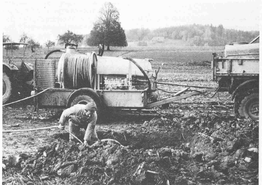
Bild 1. Spülung eines Saugers vom aufgedrungenen Anschluss her mit «Barth-Holland Dränspülgerät L 90». Wasserzufuhr mit Druckfass und aufgebaumem Tank an Unimog

In den Gesetzen und Verordnungen des Bundes ist die Unterhaltsfrage eindeutig geregelt [6]. Dasselbe gilt auch für die zahlreichen Verordnungen und Reglemente der verschiedenen Kantone. Die Unterhaltungspflicht liegt bei den Subventionsempfängern, also bei den Genossenschaften, in einzelnen Fällen können es auch die Gemeinden sein. Die direkte Aufsicht über deren Einhaltung üben die Kantone aus, in der Regel sind es die kantonalen Meliorationsämter. Die Oberaufsicht obliegt dem Bund (Eidgenössisches Meliora-