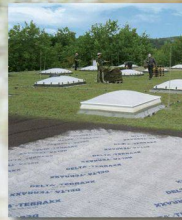
DELTA®-TERRAXX Hochwertiges Schutz- und Drainagesystem

Wer optimale Flächendrainung und perfekten Grundmauerschutz anstrebt, kommt an den DELTA®-Noppenbahnen aus dem Hause Dörken nicht vorbei. Für alle Objekte im Hoch-, Tief- und Ingenieurbau bieten sie eine hohe Sicherheit vor Feuchtigkeit. Von der Standard- bis zur innovativen High-Tech-Anwendung: Das DELTA®-Noppenbahn-Programm ist so vielseitig wie Ihre Anforderungen. Die Dörken-Experten beraten Sie gern persönlich, welche Bahn für Ihr nächstes Projekt massgeschneidert ist. Vereinbaren Sie gleich einen Gesprächstermin!