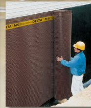
DELTA®-MS Sauberkeitsschicht, Grundmauerschutz und Sickerschicht