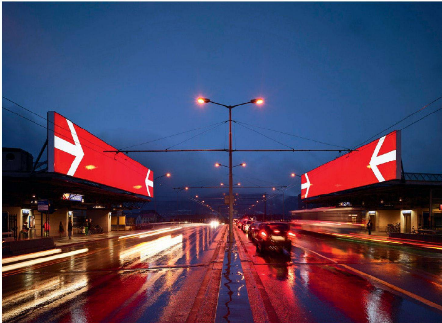
01 EM2N: Aufwertung Bahnhof Hardbrücke, Zürich, 2005–2007