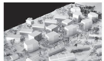
07 «Hovanna» (Chebbi/Thomet)