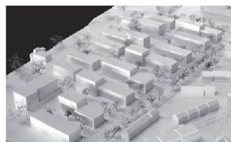
05 «Same but different» (Zach + Zünd)