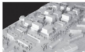
06 «Gartenstadt» (Adrian Streich)