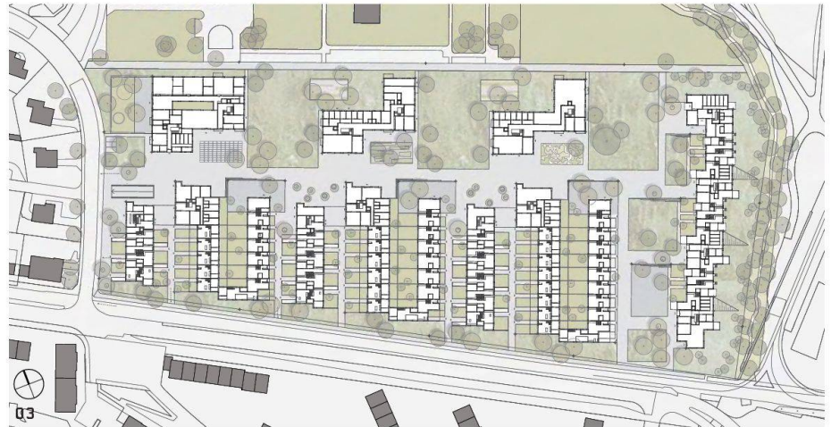
01–03 «Carlo»: Hybridsiedlungsstruktur aus niedrigen und hohen Baukörpern. Grundriss EG (Visualisierung, Modellfoto, Plan: Bachelard Wagner)

Bachelard Wagner Architekten aus Basel gewinnen den Wettbewerb für den Ersatzneubau der Siedlung Mattenhof in Zürich Schwamendingen durch eine enge Verbindung von Reihenhäusern und Geschosswohnungen.