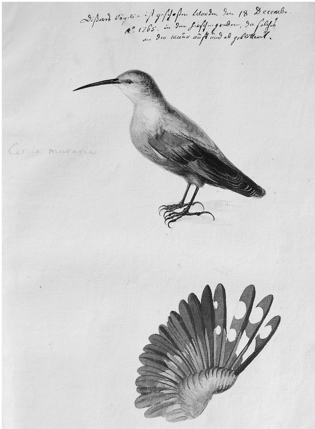
Abb. 3: Tichodroma muraria , Mauerläufer. Er wurde 1765 in Winterthur geschossen. (Winterthurer Bibliotheken, Sondersammlungen, Ms. 211, S. 47)