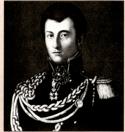
General Carl v. Clausewitz, Stabschef in verschiedenen Verwendungen in Preussen und Russland (hier in russischer Uniform). Klassiker unter den Militärdenkern.

Napoleon überdehnte seine Nachschubwege und musste sich schliesslich aus Moskau zurückziehen. Der Russlandfeldzug kostete ihn eine ganze Armee von über