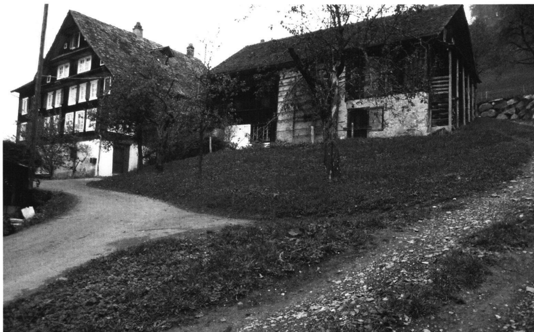
Abb. 2: Brennerei neben dem Guggli.

seinem Wohnhaus eine Brennerei ein, um den Ertrag seiner zahlreichen Obstbäume zu verwerten. Das Gebäude ist mit seinen Geräten noch erhalten. 6