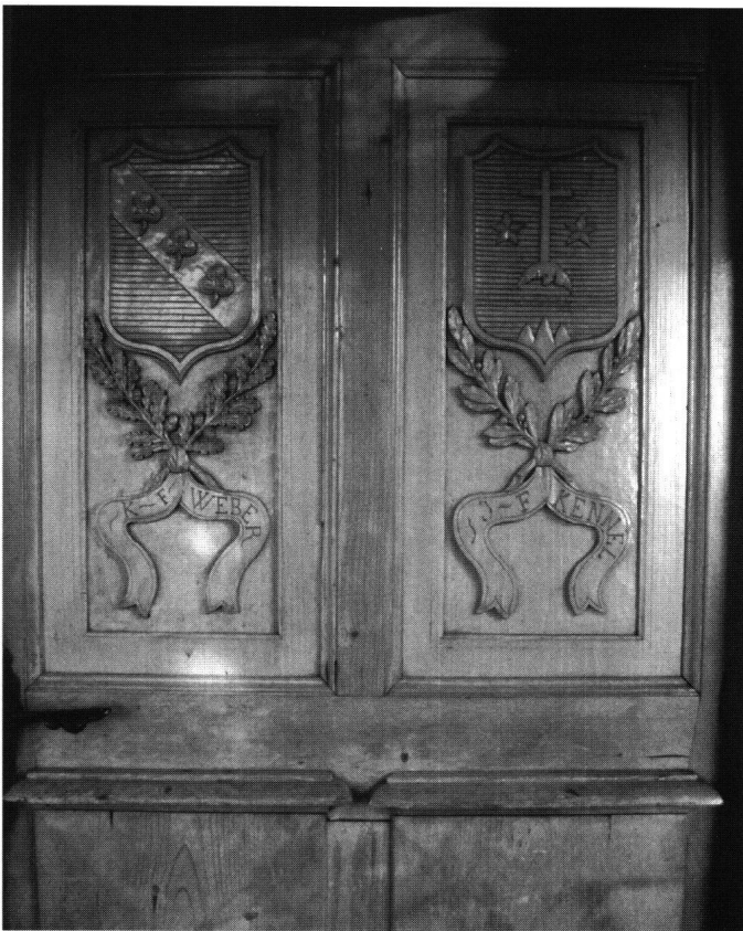
Abb. 8: Die Wappen an der Haustüre.