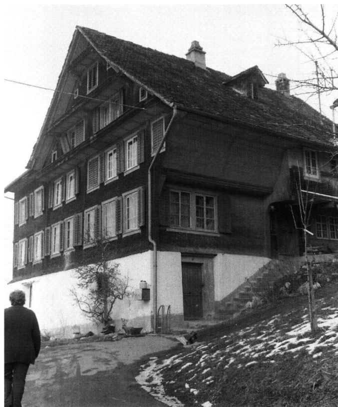
Abb. 1: Guggli.