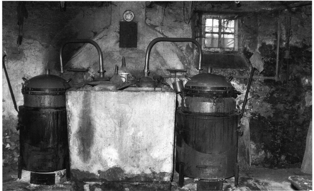
Abb. 3: Die Brennhäfen mit dem Kühlbecken.

wil» 13 versetzen bzw. unterhalb des Guggli über der Strasse neu errichten.