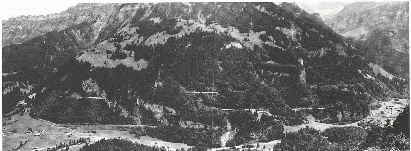
Bild 2. Die fertiggestellte Doppelspur auf der Nordrampe kurz vor der Betriebsübergabe 1988

günstigeres Licht rücken. Wenn die Totlast nicht bergauf und bergab geschleppt werden muss, fällt das Gewicht energieverbrauchsmässig auf der Eisenbahn nicht so stark in Betracht. Eindeutiger Vorteil sind die relativ kleinen Verlade- und Entladestationen und der geringe technische und organisatorische Aufwand an den Terminals. Unbefriedigend sind zurzeit noch die grossen Unterhaltsaufwendungen an den für den Huckepackverkehr eingesetzten Niederflurwagen mit den kleinen Rädern, die auch die Gleisanlagen sehr stark beanspruchen. Für ein längerfristiges Huckepacktransportsystem müssen deshalb Wagen mit weniger gedrängten Konstruktionen und grösseren Rädern eingesetzt werden können, die ihrerseits wiederum Lichtraumverhältnisse beanspruchen, wie sie bei den herkömmlichen Eisenbahntunnel nicht vorhanden sind.