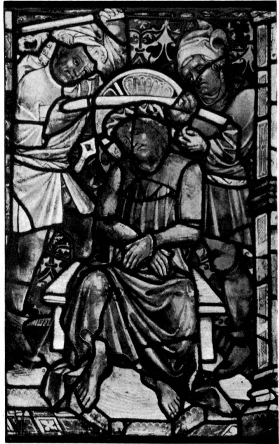
Geißelung und Dornenkrönung aus dem Passionsfenster des Berner Münsters, um 1439–1441