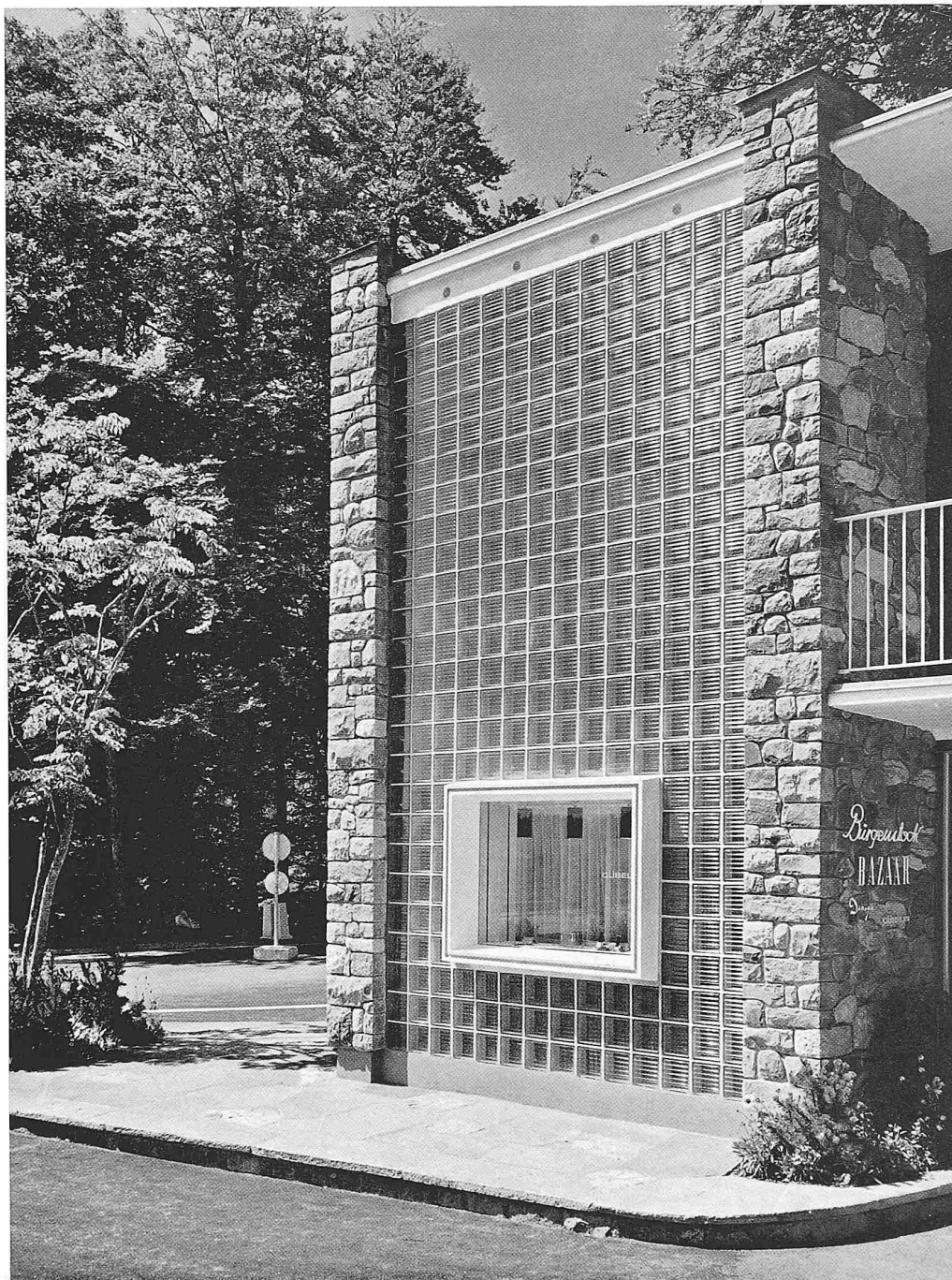
Bazaar auf dem Bürgenstock