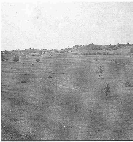
Bild 3. Natur- und Landschaftsschutz

hafte Lösungen auf. Grössere Meliorationen unterstehen der Umweltverträglichkeitsprüfung gemäss Umweltschutzgesetz.