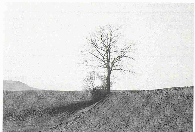
Bild 6. Raumplanung und Umweltschutz: Chance für unsere Zukunft

ist. Sie dient zur Interessenentflechtung bei Planungsfestsetzungen. Sie ist aber auch ein wichtiges Instrument bei der Herbeiführung der Baureife von Baugrundstücken und zur Strukturverbesserung in der Landwirtschaft.