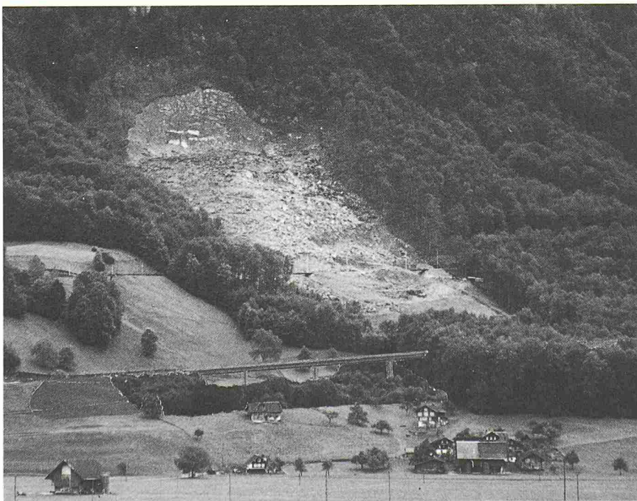
Bild 1. Gesamtansicht: N8 Querung Bergrutsch Giswil mit Brücke Buechholz (Fotomontage) gemäss Auflageprojekt

Im weiteren wird auf Steinschlaggefahr hingewiesen, und es besteht - wie frü-