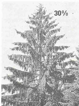
Bild 1. Mit 30% Nadelverlust gilt diese Fichte nach den Sanasilva-Erhebungen bereits als mittelstark geschädigt. Im Jahr 1987 war lediglich gut jeder zehnte Baum mittelstark oder stärker geschädigt. Bild aus [5].

Bilder 2-4 aus EAFV-Bericht Nr. 283 (1986).