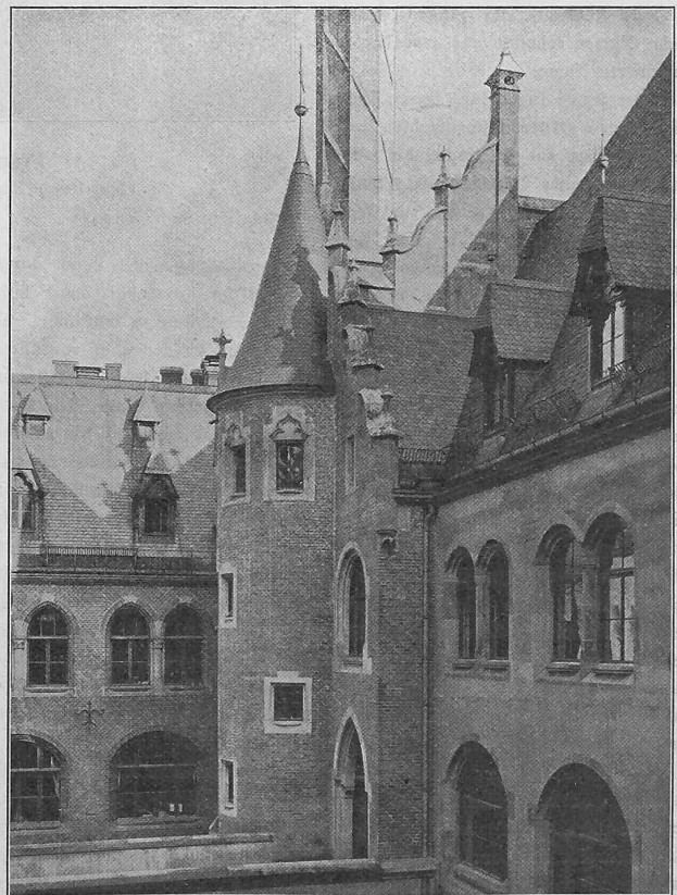
Abb. 12. Blick auf das Treppentürmchen des Kassenhofs.