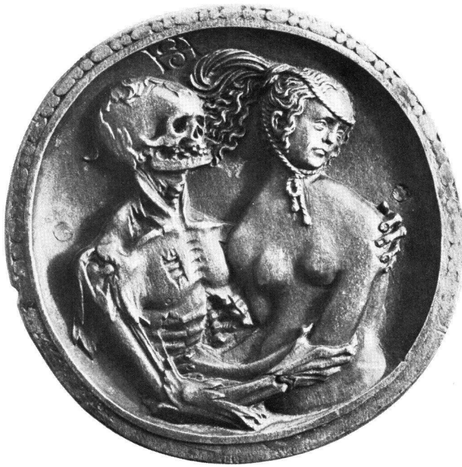
Abb. 7 Hans Schwarz: Tod und Mädchen. Um 1520. Relief in Ahornholz. Durchmesser 10,5 cm. Staatliche Museen Preußischer Kulturbesitz, Skulpturengalerie, Berlin-Dahlem (M 186)