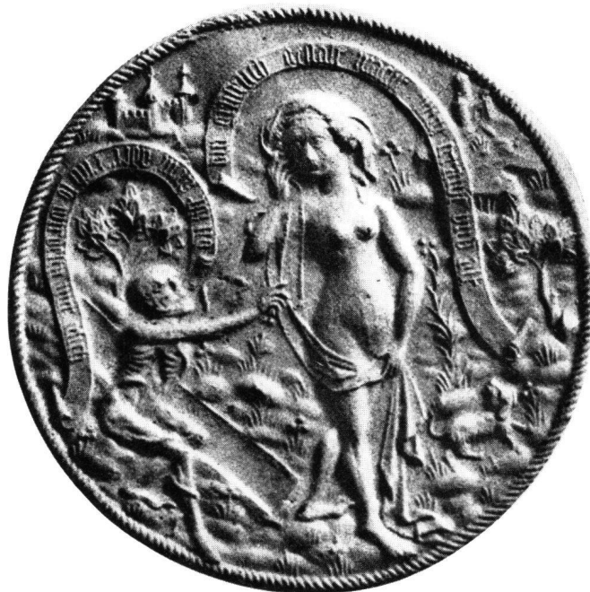
Abb. 1 Mittelrheinischer Tonmodell. Tod und Mädchen. Um 1450/70. Durchmesser 11,6 cm. Ehemalige Sammlung Figdor, Wien

Im frühesten der aggressiven «Tod-und-Mädchen»-Täfelchen Baldungs, im Bild des Bargello 8 (Abb. 4), scheint das vom Tod gepackte Mädchen dem Grab entfliehen zu wollen. Sein herabgleitendes Leichentuch zieht sich in die Gruft hinunter. Der Tod, der das Mädchen an der Flucht hindert, steht mit einem Bein im Grab. Schwarzgraue Wolken hängen über der dramatischen Szene dieser Rebellion gegen die Macht der von Tod und Sanduhr verkörperten Vergänglichkeit – Wolken etwa vergleichbar denjenigen auf Baldungs Hexendarstellungen, nur lastender. Magischer Friedhofspuk im Sinne des