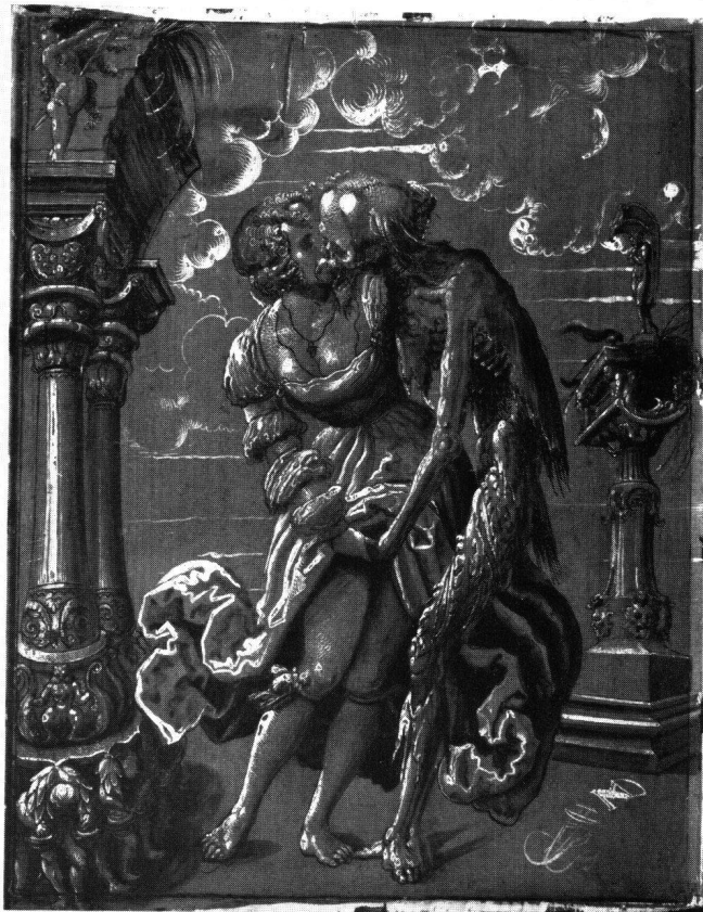
Abb. 8 Niklaus Manuel Deutsch: Tod und Dirne (auf der Rückseite der Tafel: Bathseba im Bade). 1517. 38 × 29 cm. Kunstmuseum Basel (419)

direkte Zusammenhang mit dem Totentanz gegeben ist. Manuel selber hat 1516/19 auf seinem Berner Totentanz den Tod, der mit der «Tochter» tanzt, zum aufdringlichen, Besitz ergreifenden «falschen» Liebhaber gemacht 29 . Die Frage, ob es ausgeschlossen ist, daß Manuel hier Baldung angeregt hat (entgegen der sonstigen Anreizungsrichtung, die für diese beiden Künstler angenommen wird), sei hier lediglich gestellt.