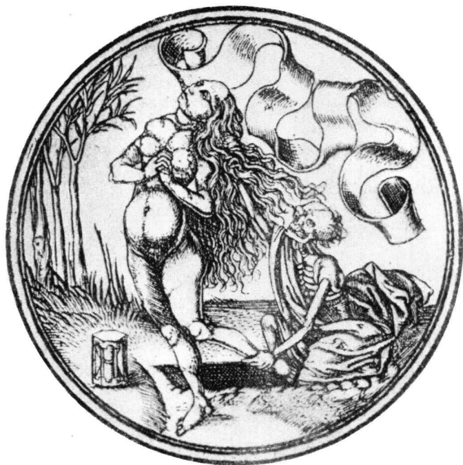
Abb. 2 Meister PW: Tod und Mädchen. Schlußblatt eines Kupferstich-Kartenspiels. Um 1505/10. Durchmesser 6,9 cm

Volksglaubens an die unerlösten «armen Seelen» und dergleichen 9 ? Die nackte Frau zeigt aber keine Spur von Verwesung. Ihre Bleichheit entspricht einem Schönheitsideal (gleich in Baldungs «Ungleichen Liebespaaren» von 1527/28, wo das Mädchen durchaus lebt, allerdings an den gewissen Tod denken sollte). Sie verweist auf Luxuria oder Vanitas, auf eine Eitelkeit, die wesentlich dem Tod geweiht ist: so auch vor Augen geführt durch eine «bleiche», noch in spätmittelalterlicher Weise ruhig-dialogische Elfenbeinstatue des nackten, auf einem Kissen stehenden, weinenden, nur mit einem Schleier bedeckten Mädchens, dem der Tod ein Kreuzifix vorhält, während im Totengerippe die Schlange, die den Apfel im Maul hat, an die Versuchung Evas und den Sündenfall, der ja den Tod mit sich brachte, erinnert 10 (Abb. 3).