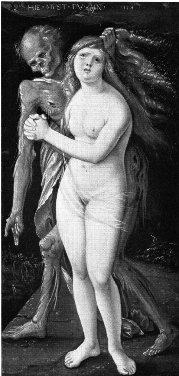
Abb. 5 Hans Baldung Grien: Der Tod und das Mädchen. 1517. 29,7 × 14,4 cm (Malfläche). Kunstmuseum Basel (18)