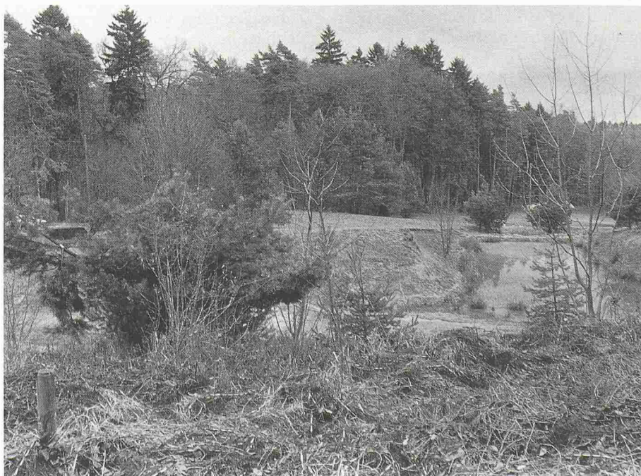
Das «Färberwisl», ein ehemaliges Lehmgrubenareal in Beringen

Bisherige Preisträger: 1984 Bex VD und Elsau ZH; 1985 Bever GR; 1986 Cavergno und Bignasco TI (Val Bavona).