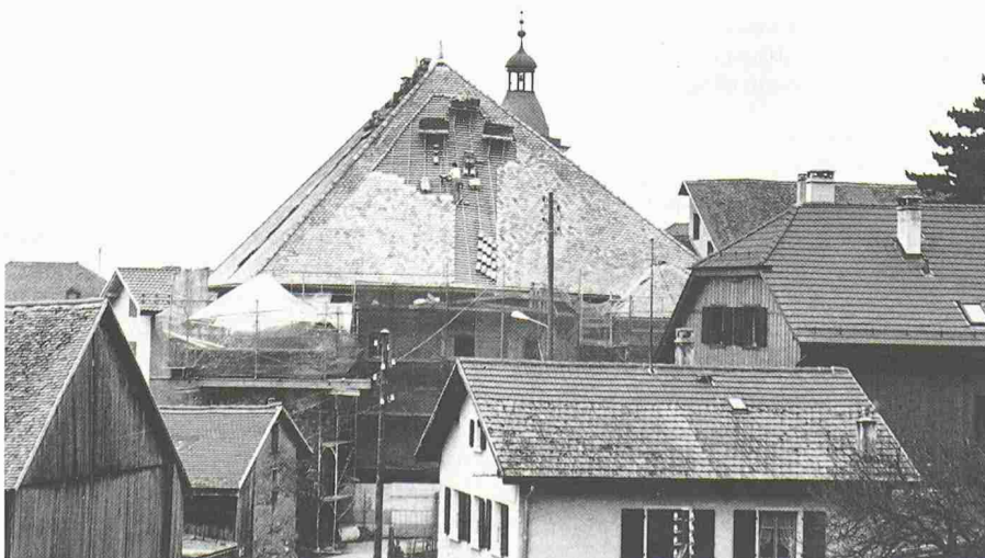
Die erste Etappe der Restaurierungsarbeiten am Schloss in Ollon VD – Reparatur des Daches und der Aussenwände – wird bald beendet sein

Der Verein und die Stiftung hatten während Jahren gegen Ansprüche eines der Besitzer sowie Einsprachen eines Nachbarn zu kämpfen. Letzterer wollte das Schloss abreißen und einen Parkplatz errichten. Die Arbeit konnte schliesslich im Dezember 1987 unter Polizeischutz aufgenommen werden.