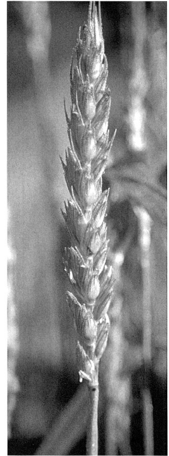
Weizen, Landsorte von Scharans. Beispiel eines lockerährigen Weizens. Diese Form findet sich erst nach dem Mittelalter.

In der Eisenzeit waren Gerste und Hirse in der Höhengiedlung Ganglegg in Südtirol die am häufigsten vorgefundenen Getreidearten. 31 Weiter wurden Nacktgerste, Emmer und Dinkel gefun-