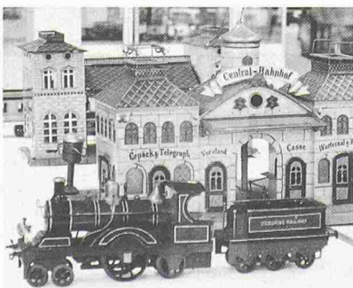
Eine Rarität aus der Sammlung A. Bommers am Technorama in Winterthur: Lokomotive von Bing, Nürnberg, Spur II, um 1902