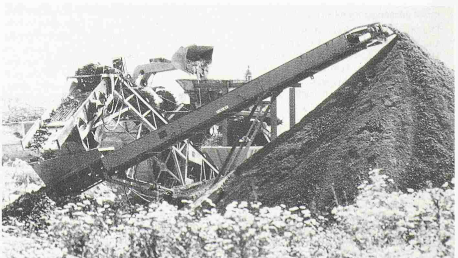
Betonwiederaufbereitungsanlage: Betonbrocken aus Abbrüchen werden mit einem Radlager in die Prallmühle eingegeben. Im Vordergrund das wiedergewonnene Baumaterial

In die Anlage eingegeben wird nur Beton, kein unsortierter Bauschutt, in dem noch andere Stoffe enthalten sind. Dadurch entsteht nach der Zertrümmerung hochwertiges Material in einer für Bauzwecke hervorragend geeigneten Kornzusammensetzung. Ein Erdbaulabor untersucht den Baustoff ständig auf seine Qualität. Er wird vor allem für den Unterbau von Strassen sowie als Bodenaustausch unter hochbelasteten Fundamenten verwendet.