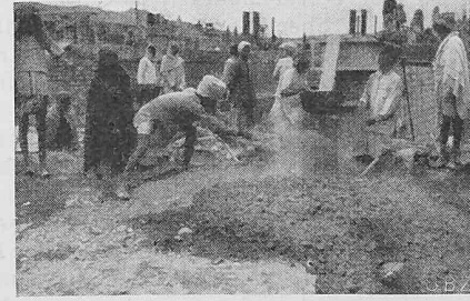
Bild 23. Nangal-Sperre. Mischen des Betons; im Bilde festgehalten die Zementzugabe.