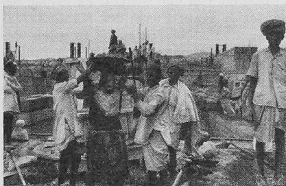
Bild 21. Nangal-Sperre. Betontransport: Auf- lad durch Männer, Transport durch Frauen vermittelt flacher, auf dem Kopf getragener Blechbecken. Die Frauen tragen meist Schleier.