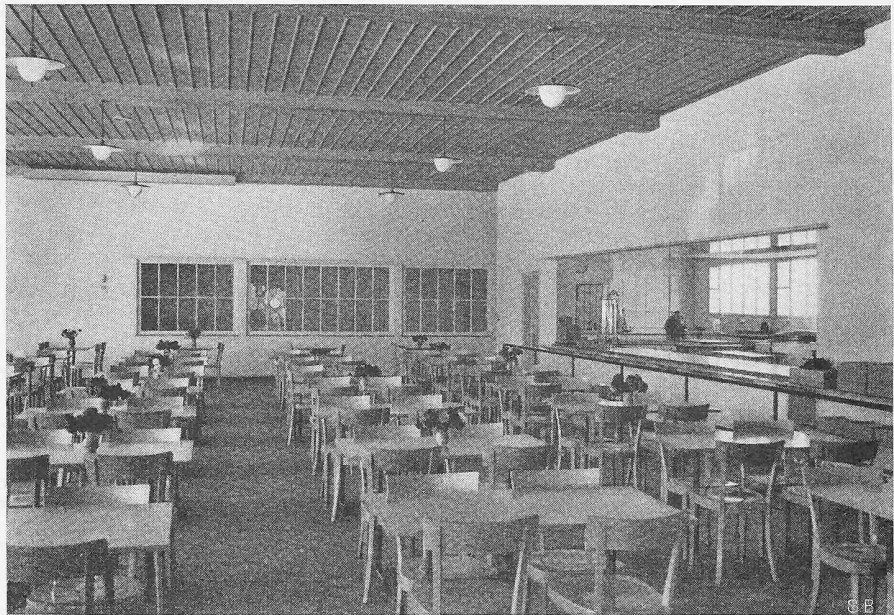
Bild 7. Arbeiterspeisesaal, Rechts Selbstbedienungsbuffet mit Durchblick zur Küchenanlage.