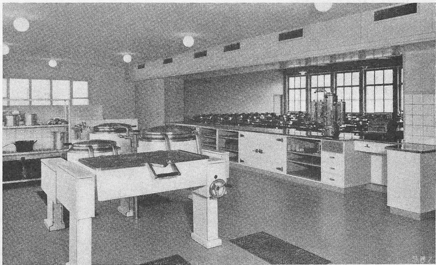
Bild 8. Küchenanlage mit Blick gegen Arbeiterspeisesaal.